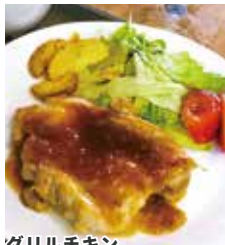
グリルチキンステーキ ¥990(税込)