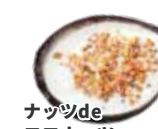
ナッツde ココナッツ アイスクリーム ¥770 (税込)