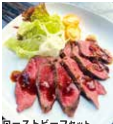
ローストビーフセット 120g ¥1,980/180g ¥2,640