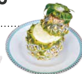
ミニパイ シャーベット ¥1,320 (税込)