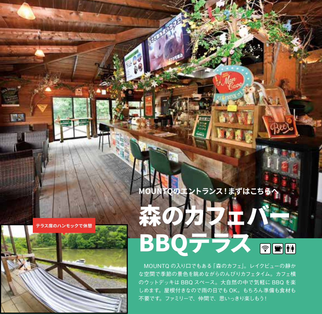
テラス席のハンモックで休憩