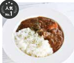
和歌山ご当地MARINEQカレー ¥1,100(税込)