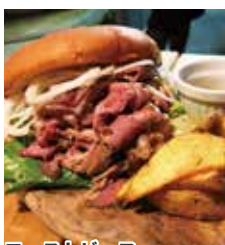
ローストビーフバーガー ¥1,210(税込)