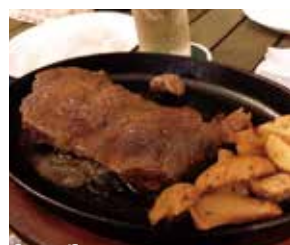
本日の牛ステーキ ライス・スープ付 250g ¥3,080(税込)

ボリューム満点! からあげ×3、ソーセージ×3、白身魚フライ×1、目玉焼き×1、ハンバーグ×1