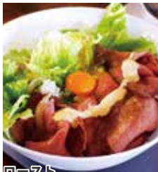
ローストビーフ丼 ¥1,210(税込)