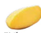
マンゴー シャーベット ¥770 (税込)