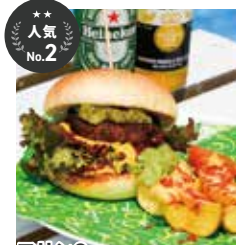
マリンQバーガー ¥990(税込)