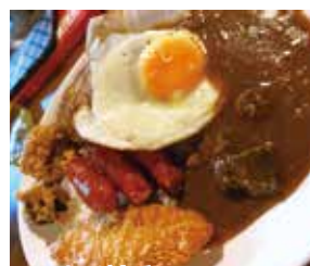
トッピング全乗せ! グランドスラム ¥2,420(税込)

ボリューム満点! からあげ×3、ソーセージ×3、白身魚フライ×1、目玉焼き×1、ハンバーグ×1