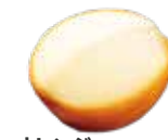
オレンジ シャーベット ¥660 (税込)