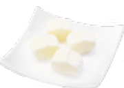
アイスde バニラ ¥495 (税込)