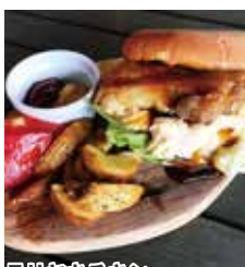
テリヤキチキンバーガー ¥1,210(税込)