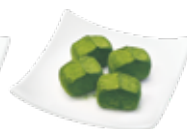
アイスde 抹茶生チョコ ¥495 (税込)