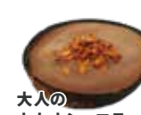
大人の カカオショコラ アイスクリーム ¥770 (税込)