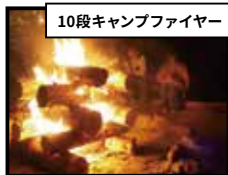
10段キャンプファイヤー