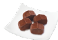
アイスde 生チョコ ¥495 (税込)