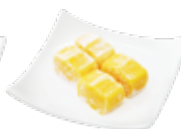
ソルベde マンゴー ¥495 (税込)