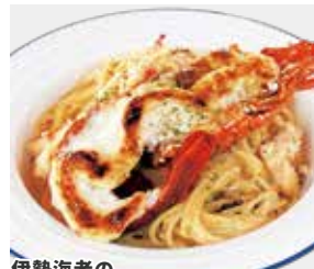
伊勢海老のクリームパスタ ¥2,750(税込)