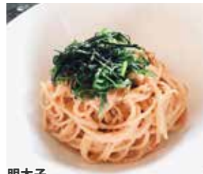
明太子クリームパスタ ¥990(税込)