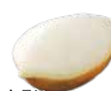
レモン シャーベット ¥660 (税込)