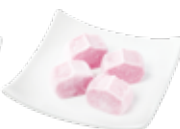
アイスde いちごみるく ¥495 (税込)