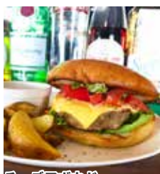
チーズアボカドQバーガー ¥1,210(税込)