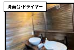
洗面台・ドライヤー