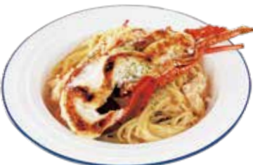
伊勢海老の クリームパスタ ¥2,500(¥2,750)