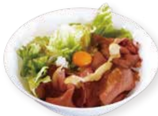
ローストビーフ丼 ¥990(¥990)

しっとり柔らかく焼き上げたローストビーフを 贅沢に載せました。生卵と一緒にどうぞ