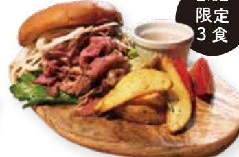
ローストビーフ バーガー ¥990(¥990)