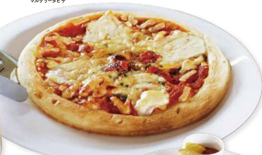
マルゲリータピザ

LUNCH TIME 11:00~15:00 CAFE & DINNER TIME 15:00~