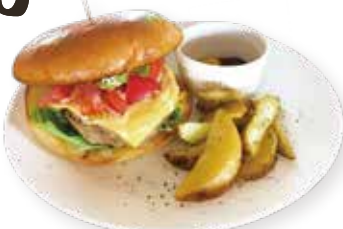
チーズアボカドQ バーガー ¥990(¥990)