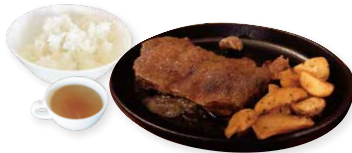
本日の牛ステーキ ライス・スープ付 250g ... ¥2,800(¥3,080)