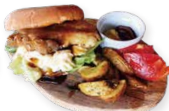
テリヤキ チキンバーガー ¥990(¥990)