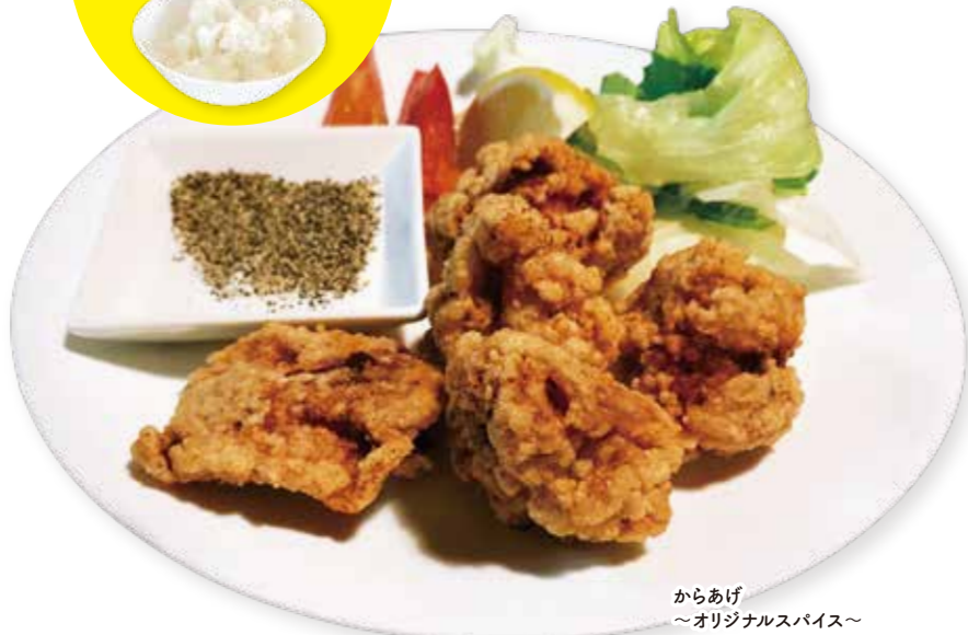
からあげ 〜オリジナルスパイス〜