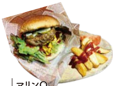
マリンQ バーガー ¥700(¥770)